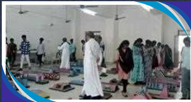
CAMPUS - LAB