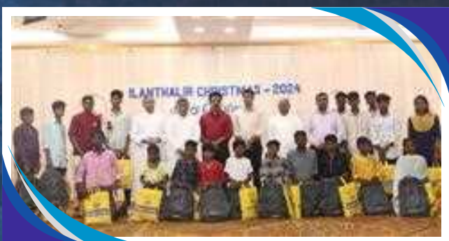
ABITO PER BAMBINI