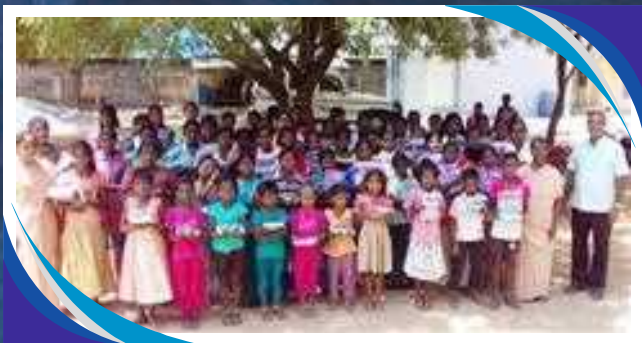
LIBRI E QUADERNI