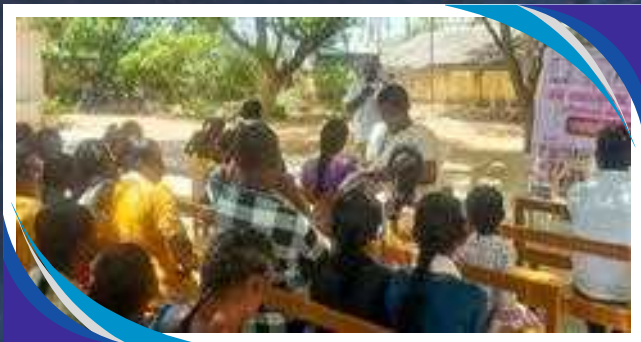
CONSAPEVOLEZZA DELLA SALUTE