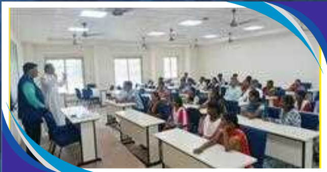
VISITA AL CAMPUS