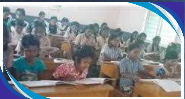
BAMBINI A STUDIO