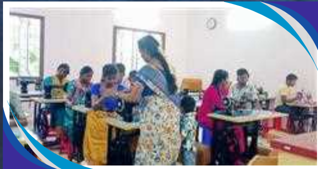
LEZIONE DI SARTORIA