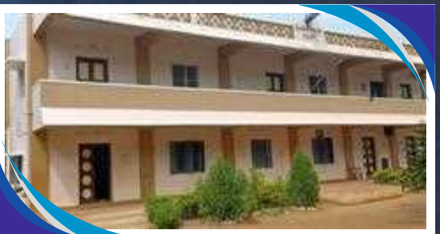
CASA PER BAMBINI