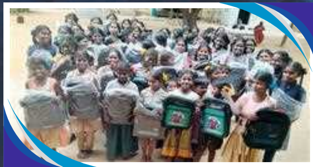
BORSE DA SCUOLAS