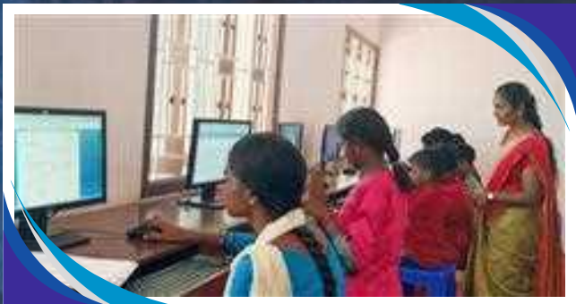
LEZIONE DI INFORMATICA